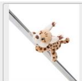
49802 01 HA Frei