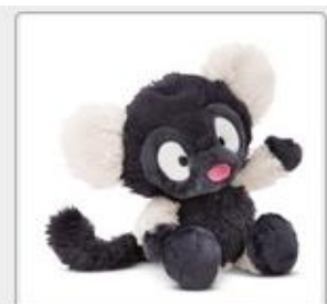
49803 01 HA Frei