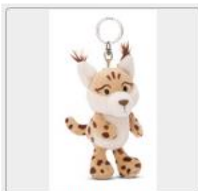
49800 01 HA Frei