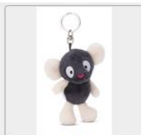
49801 01 HA Frei